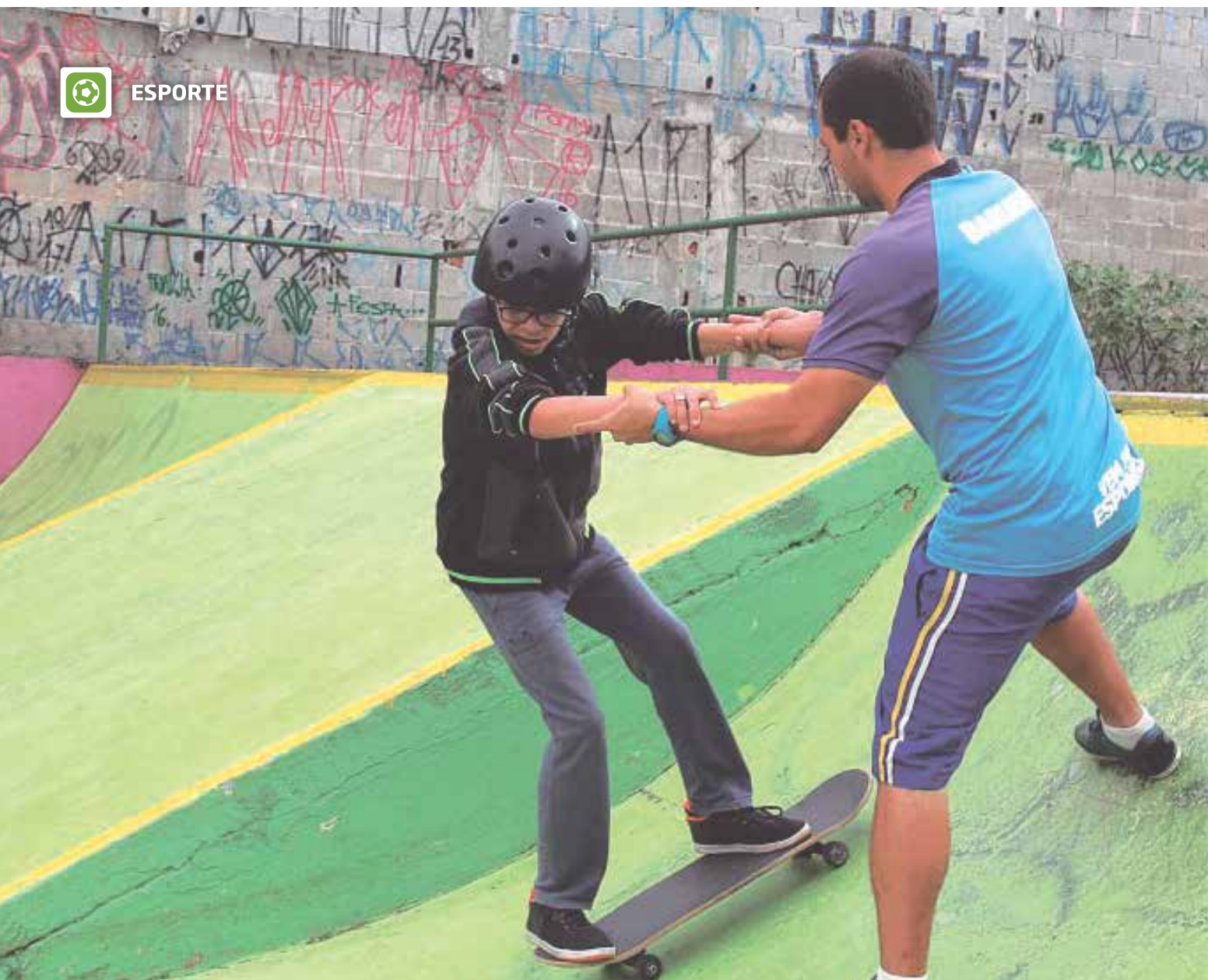
Amantes do skate têm muitas pistas à disposição em Barueri